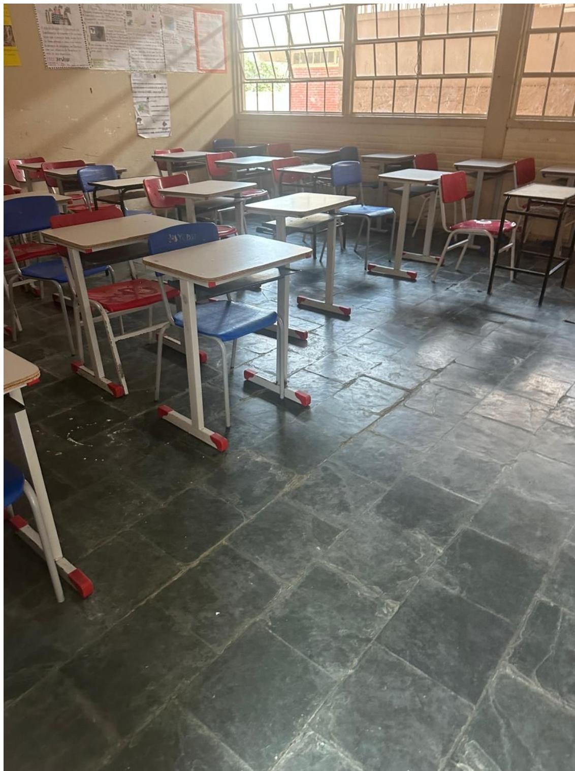
Foto 09 – Demolição de piso de Ardósia das salas térreo Pavilhão 2 e Superior Pavilhão