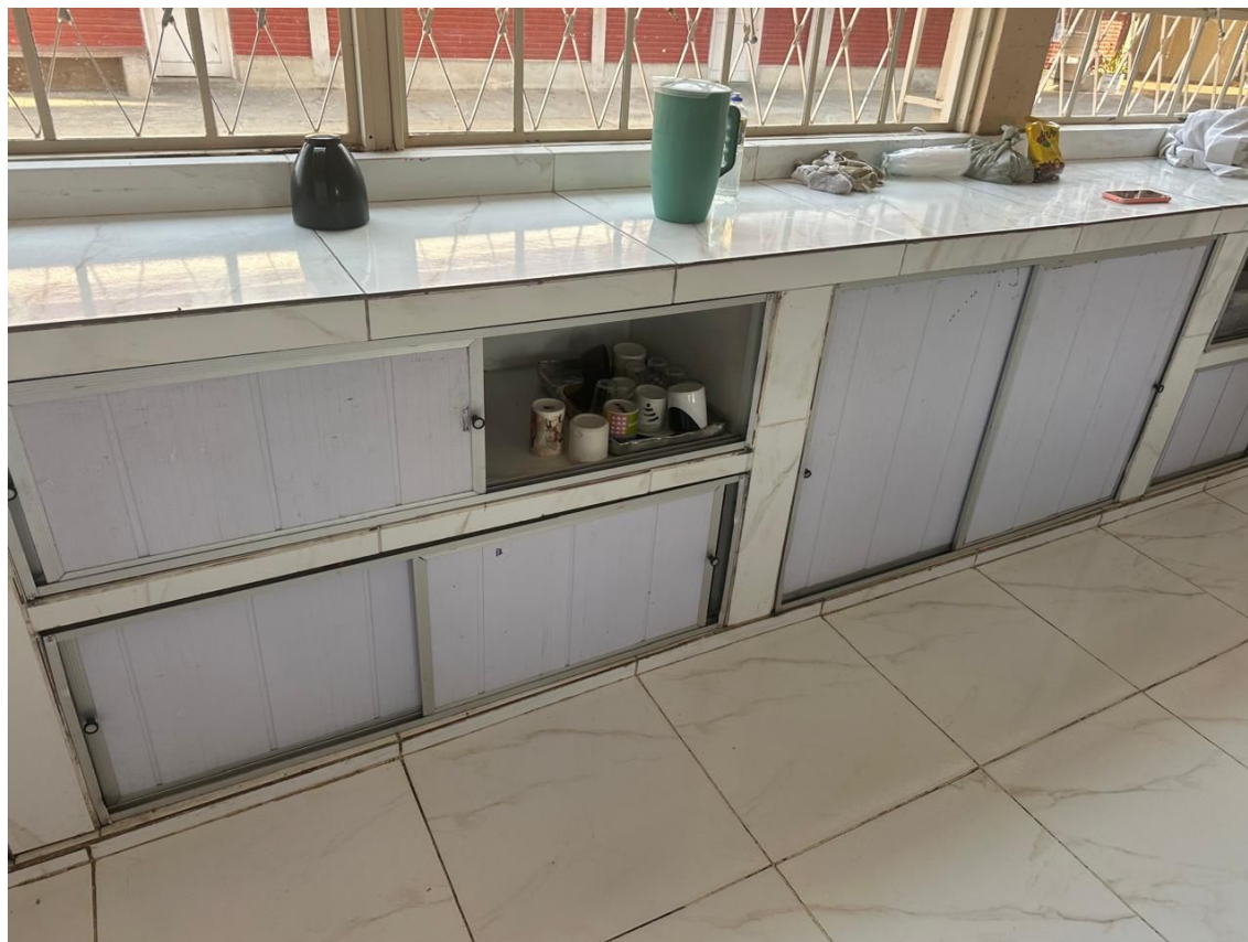
Foto 02 – Remoção do material PVC danificado, envelopamento das bancada com granito.