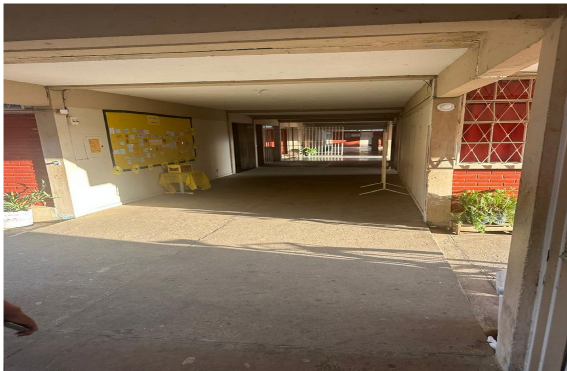
Foto 07 – Pintura corredor de circulação entre os pavilhões 1,2,3.